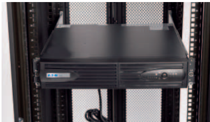
Als 2HE-Einheit im Rack